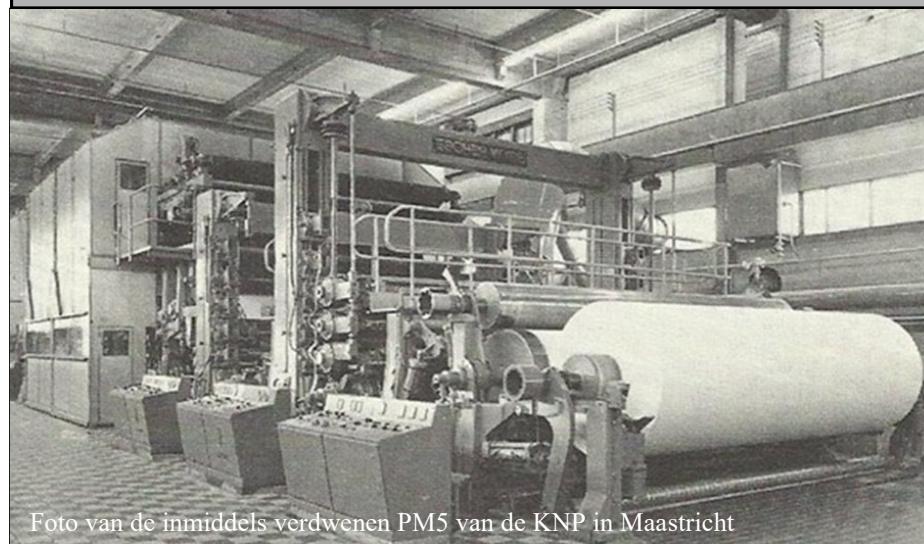
Foto van de inmiddels verdwenen PM5 van de KNP in Maastricht

In de vorige Sluisdeur heeft een stukje gestaan over de mogelijkheid om eens een papierfabriek te bezoeken. Dit is inmiddels in die zin veranderd, dat we onderweg naar Gent ook nog even Schutpapier bezoeken.